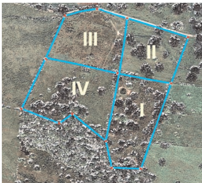
FIGURA 1. PARCELAS DELIMITADAS EL ÁREA DE ESTUDIO EN LA FINCA RANCHO ALEGRE, MUNICIPIO SAN FELIPE, YARACUY [20].

Las muestras fueron procesadas en el laboratorio de Nutrición Animal del Centro Nacional de Investigaciones Agropecuarias (CENIAP), en una muestra compuesta para cada potrero, de acuerdo a la fecha de muestreo, a las cuales se les determinó los contenidos de proteína cruda (PC) [1], fibra de-